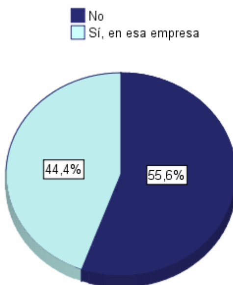
Gráfico 9.3 ¿Conseguiste empleo a través de las prácticas en empresas?

Respecto a la repercusión de estas prácticas en la obtención de empleo, tenemos que el 44,4% de los que realizaron prácticas en empresas consiguió empleo a través de ellas y en la misma empresa donde las realizó. El 55,6% no logró un empleo a través de las prácticas realizadas. (Gráfico 9.3)